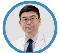
小川 誠司 日本小川优生医学中 (Tokyo ART Clinic) 院长、 日本藤田医科大学生殖中心、 主任医生, 教授