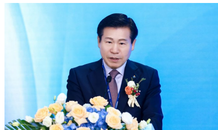
韩国大邱广域市中区政府 区长——柳圭夏