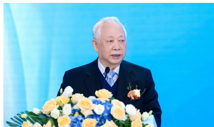
原国家卫生部副部长、 中华医学会常务副会长、中国 抗衰老促进会顾问——曹泽毅

各国旅游局、卫生健康部门 National Tourism Bureaus, Health Department.