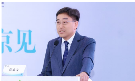
全国政协常委、香港特别行政区前食 物卫生局局长、大湾区医疗专业发展 协会荣誉会长——高永文