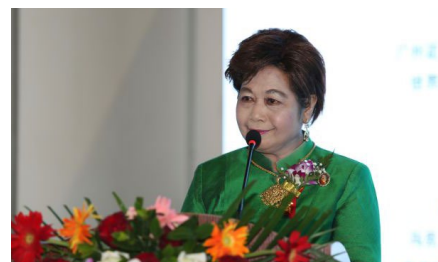
泰国卫生部外事局局长 泰国皇室亲王蒙拉查翁· 沃拉芭帕·扎伽潘